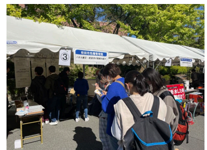
〈関大防災 Day2022 の各種防災イベントの様子〉